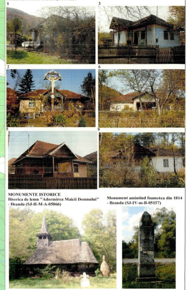
MONUMENTE ISTORICE Biserica de lemn "Adormirea Maicii Domnului" - Ileanda (SI-IV-m-B-01066) Monument aninată funerară din 1814 - Ileanda (SI-IV-m-B-05157)

P.U.G. Comuna Ileanda JUDEȚUL SĂLAJ UNITĂȚI TERRITORIALE DE REFERINȚĂ ARHITECTURA TRADITIONALĂ